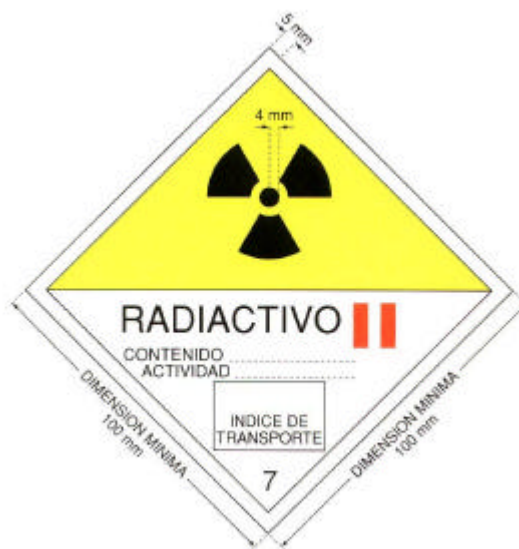
Fig. 3. Etiqueta para la categoría II-AMARILLA.

El color de fondo de la mitad superior de la etiqueta será amarillo y el de la mitad inferior blanco, el trébol y los caracteres y líneas impresos serán negros y las barras que indican la categoría serán rojas.