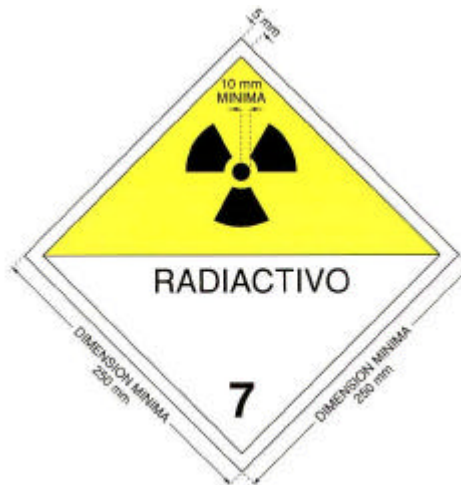
Fig. 5. Rotulo

Las dimensiones de este modelo son las mínimas; cuando se utilicen rótulos de distintas dimensiones se guardarán las mismas proporciones que en el modelo.