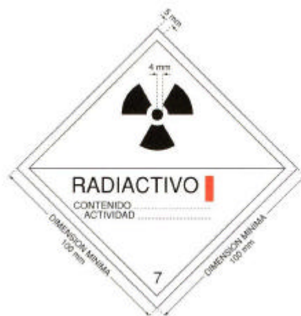
Fig. 2. Etiqueta para la categoría I-BLANCA.

El color de fondo de la etiqueta será blanco, el trébol y los caracteres y líneas impresos serán negros y la barra que indica la categoría será roja.