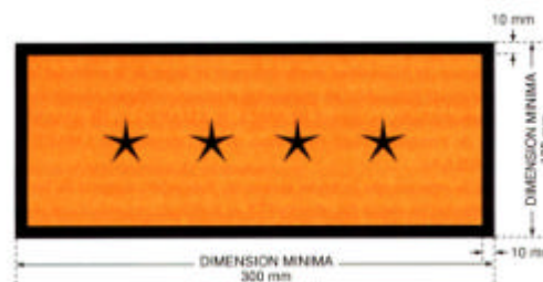
Fig. 6. Rótulo para indicar por separado el número de Naciones Unidas. El color de fondo del rótulo será naranja y los bordes y el número de Naciones Unidas serán negros.

El empleo del término “RADIATIVO” en la mitad inferior es facultativo, con el fin de permitir también la utilización de este rótulo para indicar el número apropiado de las Naciones Unidas correspondiente a la remesa.